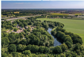
Kromme Rijn Linie Landschap