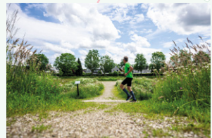
De Roode Haan

Provincie, gemeenten, waterschappen en andere pactpartners doen in voorbeeldgebieden praktijkervaring op met Groen Groeit Mee. Deze voorbeeldgebieden zijn geen statistische projecten maar plekken waar geleefd, geleerd en door verschillende partijen samen concreet aan een groenere provincie gewerkt wordt.